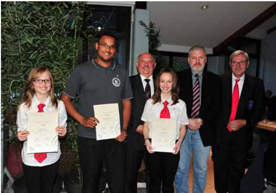
BZ: Mit dem Jugendabzeichen für fünf Jahre Aktivität konnten sich gleich drei Musikanten der „Useldenger Musik“ sich freuen.

Projects“ freuen die im Anschluss an ihre Dankesworte die Ziele der verschiedenen Projekte in Südafrika ihrer Vereinigung auch kurz vorstellte. Beim Schlusswort hob Bürgermeister Pollo Bodem die Wichtigkeit sowie den Stellenwert der Musikgesellschaft im kulturellen Leben der Gemeinde Useldingen besonders hervor, unterstrich die besonders gute Formation der Musikanten in der Musikschule des Redinger Kantons und betonte dass dieser Galaabend als wahrer Hochgenuss und dem amerikanischen Volk gewidmet war, zudem wir als Europäer heute noch sehr viel zu verdanken haben.