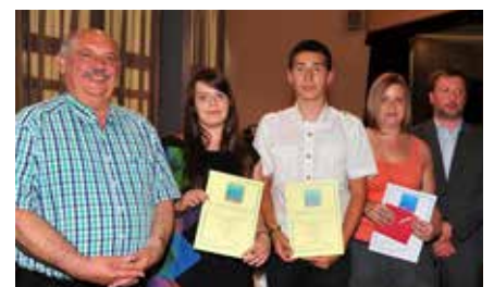
Die Diplomüberreichung an die 161 Laureaten der Redinger Musikschule fand dieses Jahr im Kulturzentrum in Beckerich statt.